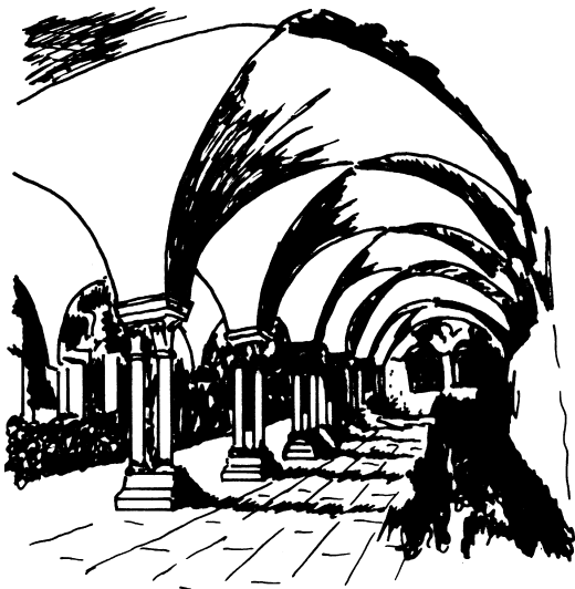
Abb.: Ansprechende Bauformen mit eigener Identität schaffen Geborgenheit und berühren die Seele