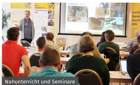
Nahunterricht und Seminare