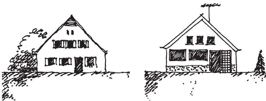
Auflösung der Fassaden-Fenster-Tür-Gestalt durch Vielfalt an ortsfremden Formen und Materialien

Ein Raum oder eine Fassade sollte nicht nach Belieben bemessen und proportioniert sein, sondern es sollte ein sinnvoll abgeleitetes Maßsystem zugrunde liegen.