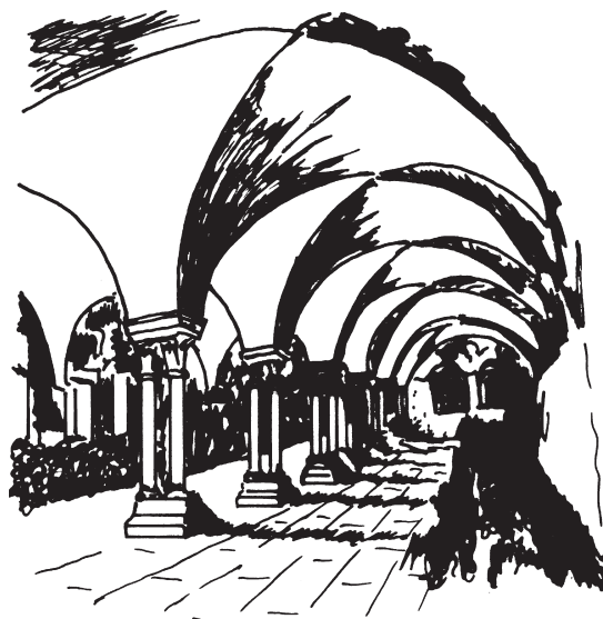
Abb. 6 Ansprechende Bau- formen mit eigener Identität schaffen Geborgenheit und berühren die Seele

Formen, die zu uns "sprechen", können z.B. sein: interessant gestaltete Öffnungen mit Durchblicken, organische Baukörper, Meditationsgärten, zeitlose Gebäude (Tempel, Pagoden) oder auch manche Symbole , z.B. Mandalas. Symbole gehören zu der Welt des analogen Denkens, sie stehen für etwas, eine Kraft, eine Aussage, einen Wert... ..... s. Kap. 2.6